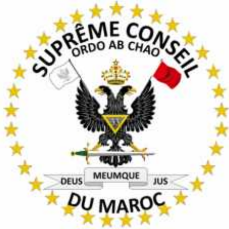
المجلس السامي للماسونية في المغرب